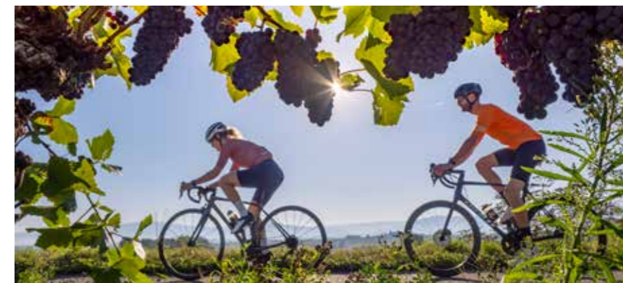
Aktiv den Herbst genießen – zum Beispiel bei der Kaiserstuhl-Tuniberg-Radtour am 3. September

Ort: Vogtsburg-Burkheim Uhrzeit: 12.00 Uhr Tickets: stadtkapelle-burkheim.de