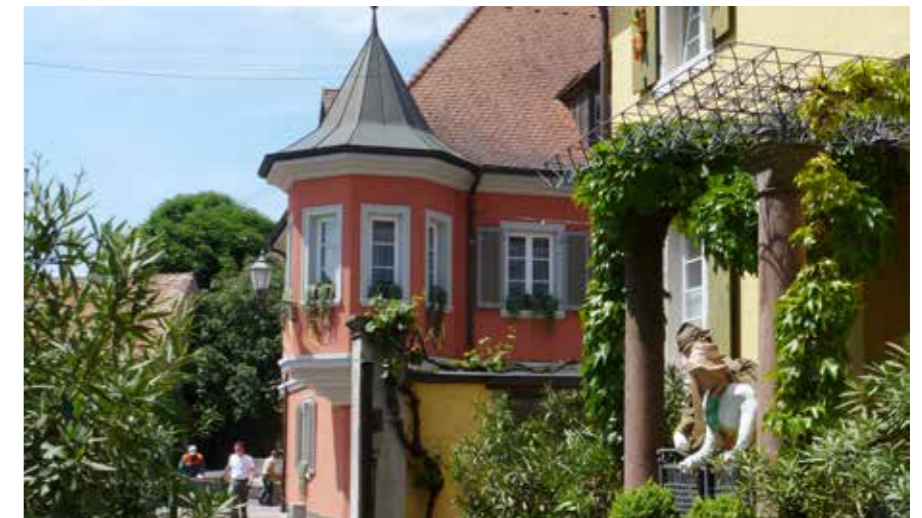
Ihringen (großes Bild links) ist eine typische Weinbaugemeinde am Kaiserstuhl. Oben: das Rathaus

Das forstliche Arboretum Liliental ist ein exotisches Waldparadies mitten in der