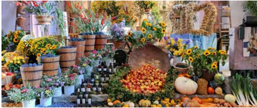
Zum Erntedankfest und Herbstausklang am 15. Oktober putzt sich der Weinort Ihringen heraus.