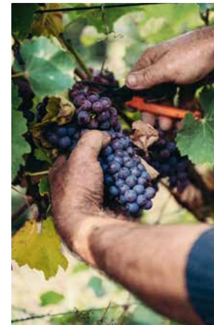
Jetzt sind die Trauben reif für die Ernte.

Ort: Ihringen, Liliental, Brunnen Uhrzeit: 10.00 Uhr zumkraeutergaertle-ihringen.de