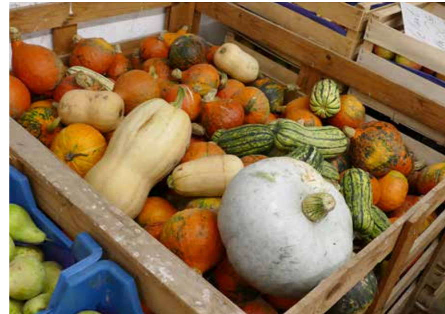
Landwirt Jürgen Billmann (großes Bild links) verkauft im Herbst verschiedene Kürbissorten (o.).