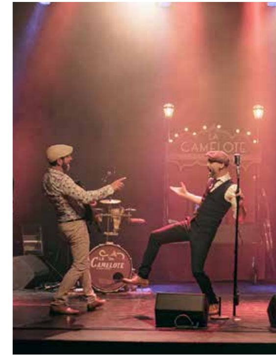
Von der Art'Rhena aus (großes Bild links) hat man einen schönen Blick über den Rhein hinweg nach Breisach (o. l.). Höhepunkte im Veranstaltungskalender sind zum Beispiel der Auftritt von „Les Virtuoses“ am 6. Oktober und das Weihnachtskonzert der Band „La Camelote“ am 16. Dezember (o. r.).