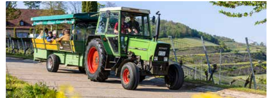
Expedition Kaiserstuhl: Bei einer Tour mit dem Winzer erfährt man Wissenswertes über die Natur.

Rasante Fahrten wechseln sich mit lehrreichen Stopps, schöner Landschaft und Aussicht ab. Auf der Amolterer Heide, dem ältesten Kaiserstühler Naturschutzgebiet,